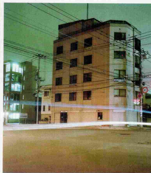
Iz serije Sapporonight, 2008 brizgalni tisk, 100 x 100 cm

grafij ne razberemo le različnih standardov, temveč so (ne)hote tudi kritika potreb v različno razvitih okoljih; v nas se pojavi vprašanje, kaj želimo doseči in kaj zares potrebujemo (npr. za čiščenje). Morda je sporočilna simbolika tudi v samem čiščenju.