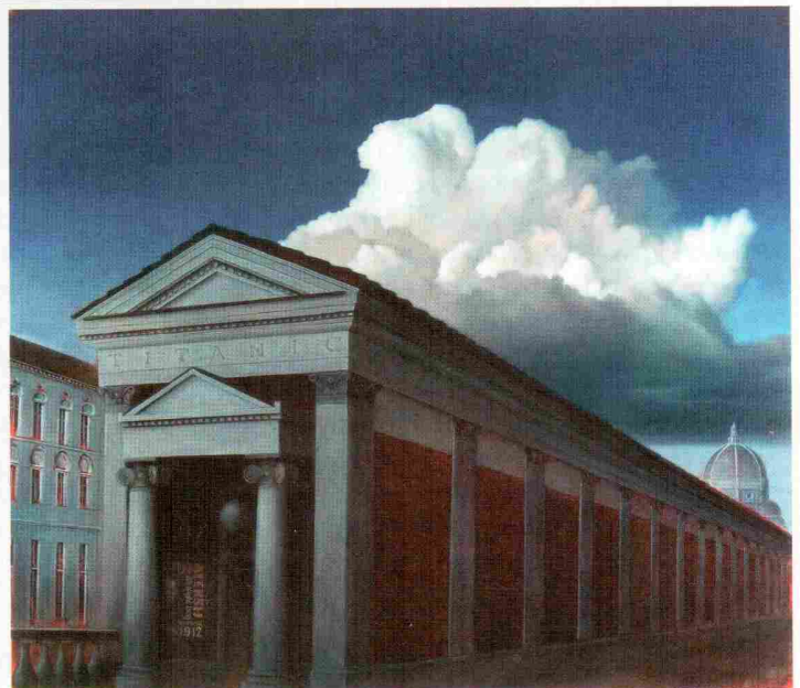
Titanic, 2010, olje na platnu, 200 x 230 cm

Na edini sliki, kjer je uporabljena zelena barva, je osamljen podeželski dvorec z gozdom v ozadju, vendar ograjen z mrežo. Je brez vrat, nad oknom pa sveti močna luč. K hiši vodi široka cesta. Učinkuje nekoliko strašljivo.